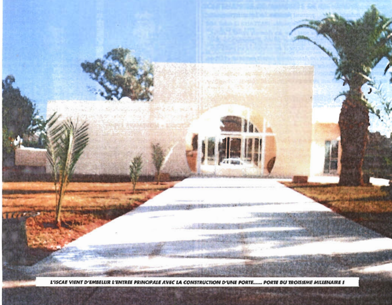
L'ISCAE VIENT D'EMBELLIR L'ENTREE PRINCIPALE AVEC LA CONSTRUCTION D'UNE PORTE..... PORTE DU TROISIEME MILLENAIRE I

RESULTAT DE L'ENQUETE D'IMAGE REALISEE AUPRES DES RESPONSABLES ET CHEFS D'ENTREPRISES EN 1999 (Page 5)